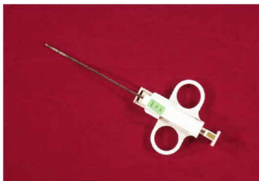
мал. 6. Біопсійна голка для відбору зразків секційних матеріалів

для мінімізації інфікування персоналу застосовувати біопсійну голку (мал. 6);