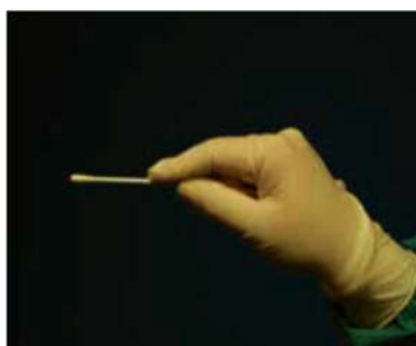
мал. 2. Паличка з тампоном взята неправильно