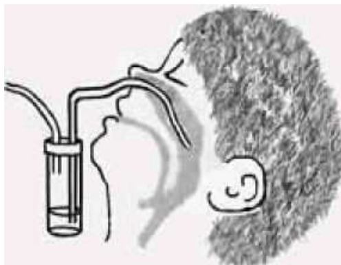
мал. 5. Взяття фарингального аспірату