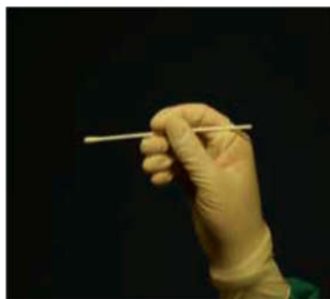
мал. 1. Паличка з тампоном взята правильно

1) Під час відбору паличку з тампоном затискають між великим, вказівним та середнім пальцями так, щоб паличка проходила наче олівець (мал. 1), а не впиралася у долоню (мал. 2). Це необхідно для забезпечення безпеки пацієнта: у першому випадку паличка просковзне в безпечному напрямку, в другому – рух палички буде обмежений, тому пацієнт може травмуватися.