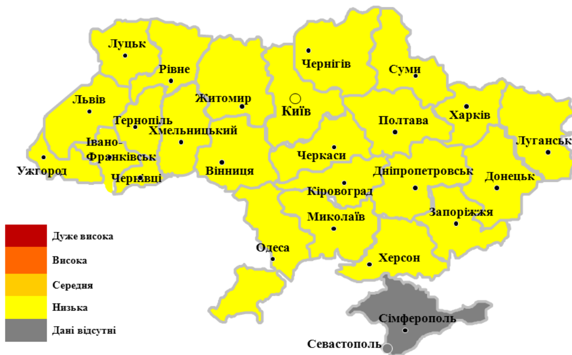
Мал.3. Інтенсивність активності грипу та ГРВІ в Україні, 42/2018

Госпіталізовано 3,0 % від загальної кількості захворілих. Найбільше госпіталізованих серед дітей віком 0 – 4 роки, найменше – серед осіб 65 років та старше.