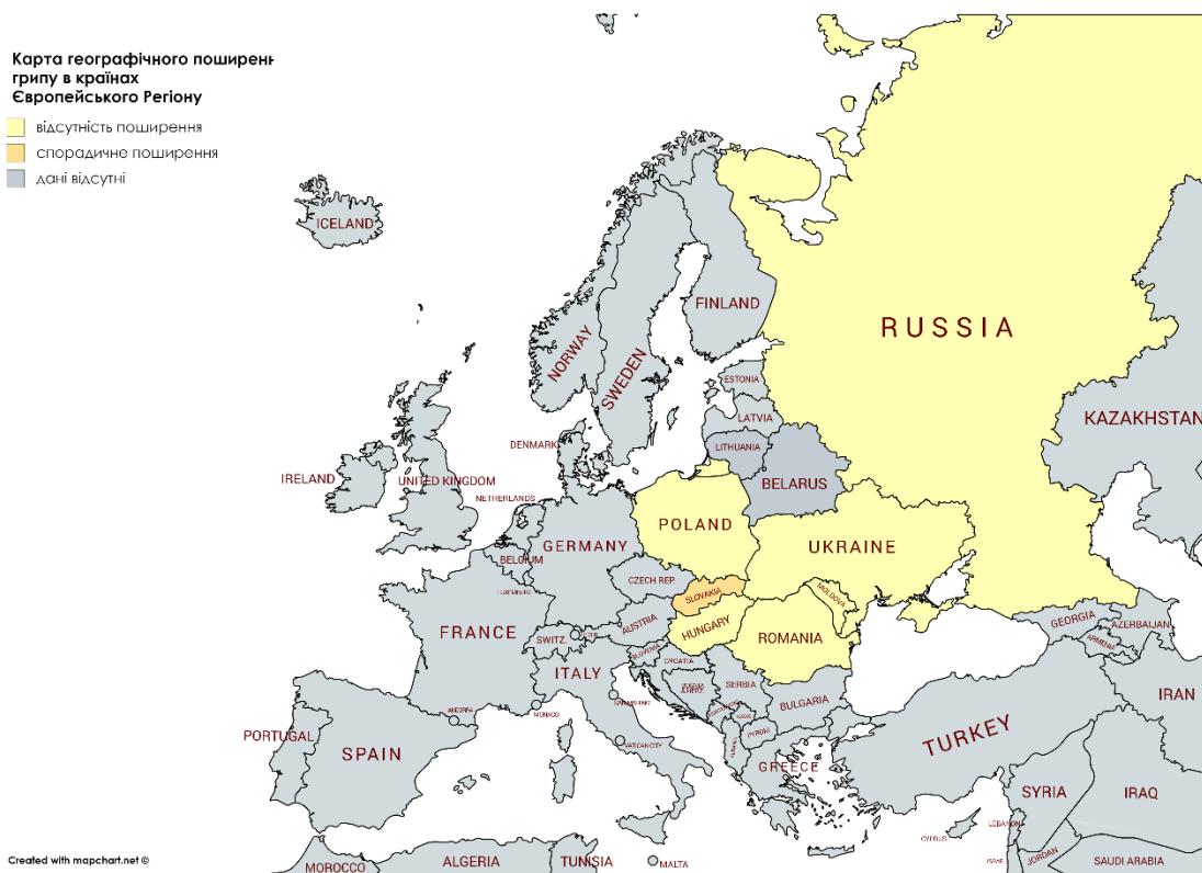
Мал. 1. Адаптовано на основі карти географічного поширення грипу в країнах Європейського Регіону ( http://flunewseurope.org ) за 41 тиждень 2018 року

За даними спільного бюлетеню ВООЗ та Європейського Центру по контролю за хворобами ( http://flunewseurope.org ) в країнах, що межують з Україною, спостерігається низька інтенсивність активності грипу та відсутність географічного поширення грипу, окрім Словаччини, де зазначалося спорадичне виявлення вірусів грипу в зразках матеріалів, взятих від пацієнтів з респіраторними захворюваннями, які зверталися за медичною допомогою (малюнок 1).